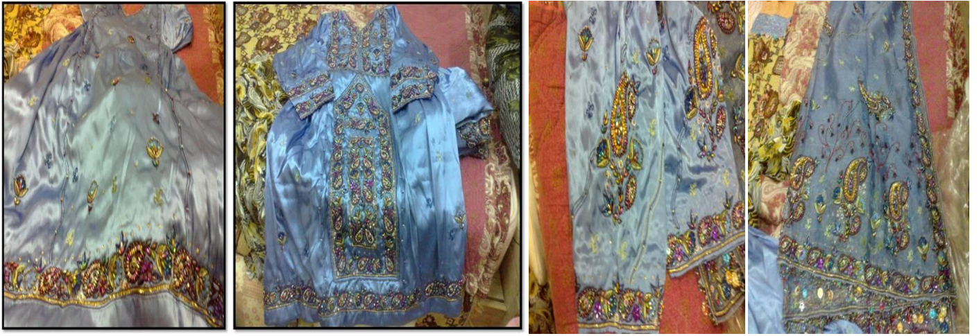
البوشي 1 تفصيل 100+تركيب 5 بيع 40