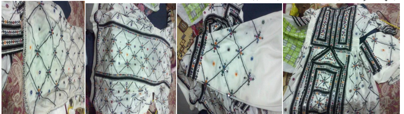
بلوشي 5 تقليدي خياطة يد تفصيل باكستان قرية تفصيل ب 50 مع التركيب والكوريشيه بيع 20