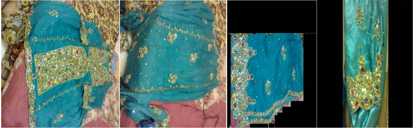
البوشي 2 تفصيل 300+تركيب 10 بيع 100