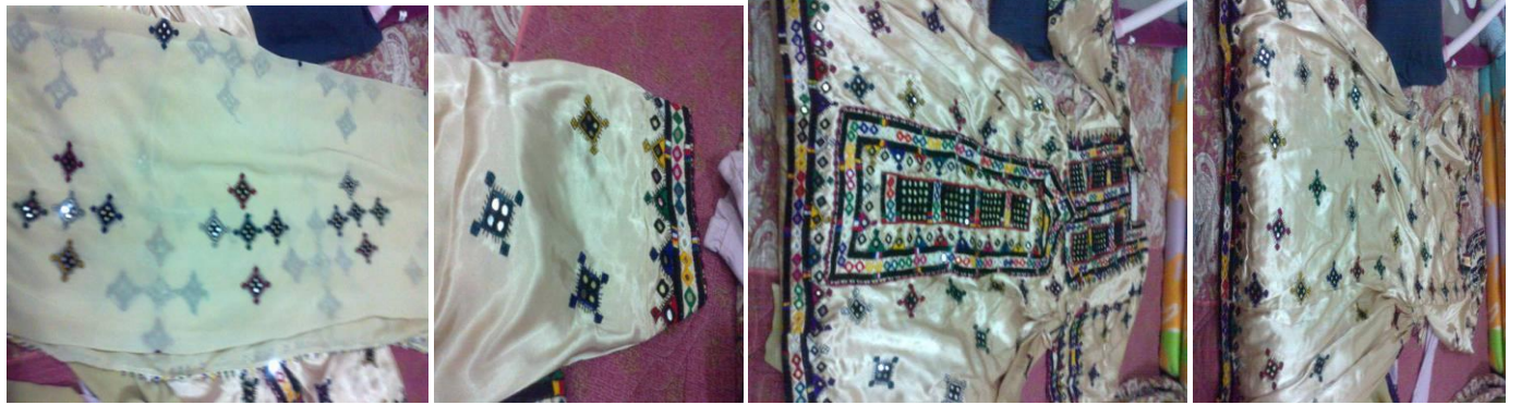
بلوشي 3 تقليدي خياطة يد مع تركيب مرايا تفصيل باكستان قرية تفصيل ب 50 مع التركيب والكوريشيه بيع 20 بلوشي 4 تقليدي نفس الموصفات بس الخياطه غير مامصور بنفس القيمه